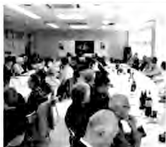
初参加ながら、その盛況ぶりに感激