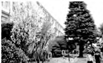
▲母校正面玄関の左手に平成6年、高9回生が寄贈したハナモモが今年も見事に咲いた (関連記事6面)