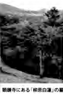
願鐘寺にある「柳原白蓮」の墓

高校A組に日本人形を送ってきましく、そのバスガイドさんが厚木高校A組に日本人形を送ってきました。その間の「やりとり」は、本人たちには判りませんが、その人形をクラス担任のK先生が預かっていました。K先生が定年を迎えるに当たり、その人形の管理を秦野の同級生に託してくるという「おまけ」までついています。