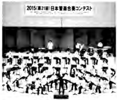
2015(第21回)日本音楽合奏コンテスト

1月24日、新宿文化センターで開かれたWe are Sneaker Age 関東大会で2年生バンド「Advance RC」(アドバンス)が準グランプリ校賞を獲得した。