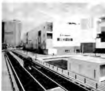
発展著しい海老名駅西口地区

現在、扇町地区では、海老名駅西口土地地区画整理事業を展開していますが、「ららぽーと海老名」を始めホテル、マンション、アパート、保育園やテナントビルなど多くの施設が続々と誕生しています。区画整理事業が終了した後も持続した発展が必要であることから、