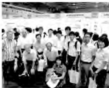
SSH全国大会出場の後輩を激励に

4年生2学期から新体制での勉強は、今まで使用していた教科書の厚塗りから始まり、遅れを取り戻す勉強が始まった。昭和22年(5年生)、3月めでたく卒業と相成った。