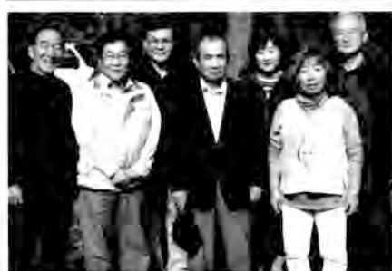
「懐い出の杜」にハナモモを植樹した相模原戸陵会のメンバー

現在では担当月に当たった幹事がある程度下見をして、本番のルートや立ち寄り箇所、見所、最後の反省会などの計画を立て参加者にメールで案内します。