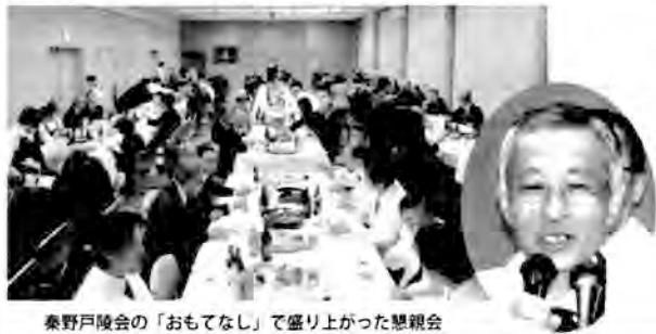
秦野戸陵会の「おもてなし」で盛り上がった懇親会