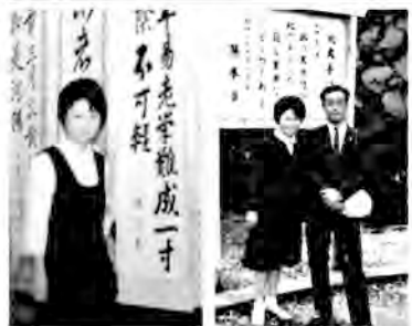
筆者の厚高時代の思い出の写真

さて今はというと、学校林を朝に夕に仰ぎ見、春の芽吹き、特に秋は朝日を浴びてキラキラ光る照葉に眺めせし間の今日この頃です。