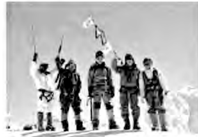
2000年10月31日、ヒマラヤ「アイランドピーク」登頂