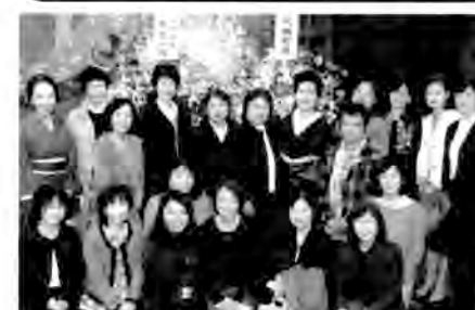
終演後は、何組かに分かれて記念撮影

さくら戸陵会には女性の同窓生の集まりです。一度に全員へのお声掛けが出来ないためにお知らせをしています。今年は高27回の方を中心にご案内を送付する予定です。是非この機会にご参加いただけますようお願いいたします。