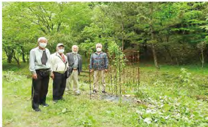
△ハナモモの成長 「ハナモモ」の様子を観察しました。食害防止柵の効果もあり順調に生育しています。