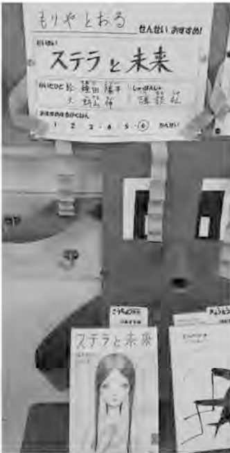
図書室のお薦めの本コーナー

七沢温泉に転居し、元湯玉川館を開いた。大畑先生も二、三度来館され、父と親しく話をされていたことを思い出す。