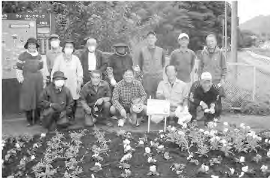
地域の日枝老人クラブと共に活動

新型コロナウイルスの感染拡大に伴い、社会活動の自粛等により各地域の行事や活動の中止が相次いでいます。小鮎戸陵会においても同様に活動が停滞している状況です。 新型コロナウイルスの感染拡大に加え、最近の世界情勢の変動により人々の心に不安感が積み重なり、閉塞感漂う社会環境が2年半続いています。社会生活は大きく変化し、企業や学校におけるテレワークやオンライン教育などが取り入れられ個人個人がモニ