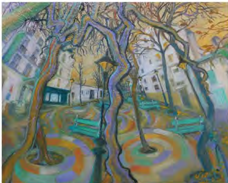
サロン・ドートンヌ2021入賞作品『洗濯船』

「洗濯船」を皆さんはご存じだろうか? パリのモンマルトルにある、ピカソやモディリアーニなどの著名な画家が暮らしたアパートの名前である。1970年代にアパートは焼失し、今はその名を記したショーウインドウがあるのみだが、その前にある広場は、何とも言えない雰囲気 私に満ちている。私はいろんな偶然に導かれて、2017年にここを訪れた。以来、来自分で勝手に「運命の土地」と決めて、足しげく通うようになった。 当時は2006年に発症した難病の膠原病がやっと回復期に差し掛かったばかり。2008年に難