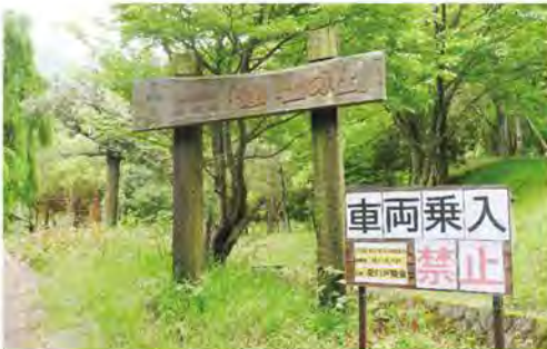
△車両乗入禁止看板 『憶い出の杜』に車を乗入れる方がいるため、「車両乗入禁止」の看板を立てて出入口斜面の崩壊防止対策をしました。