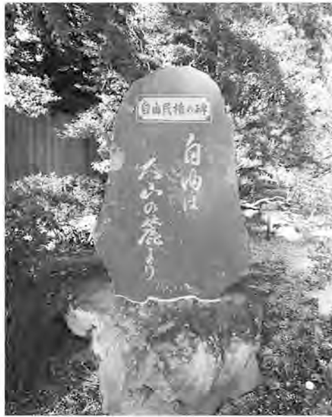
雨岳文庫にある自由民権の碑に彫られた大畑先生の言葉 安在邦夫先生(早稲田大学名誉教授)が揮毫

板垣退助を中心に自由・平等・民権を求める運動は、相州では明治13年頃から国会開設を求める運動に端を発し、県内各地で次々に結社が誕生し盛り上がった。明治17年、松方デフレ政策の結果、農産物価、繭価格も大暴落し、深刻な経済危機に陥った。国民の生活は困窮を極めたが、これに対し藩閥・専制政府は力で言論・集会・結社を激しく弾圧。自由党も解党させられた。この厳しい規制のもと、自由党左派のリーダー大井憲太郎は、朝鮮独立を助けると同時に早期に立憲政治を実現すべく武力蜂起を計画。が、軍資金が不足。そこで非常手段として公金強奪を指示。相州自由党グループに実行させた。明治18年の暮れ、この計