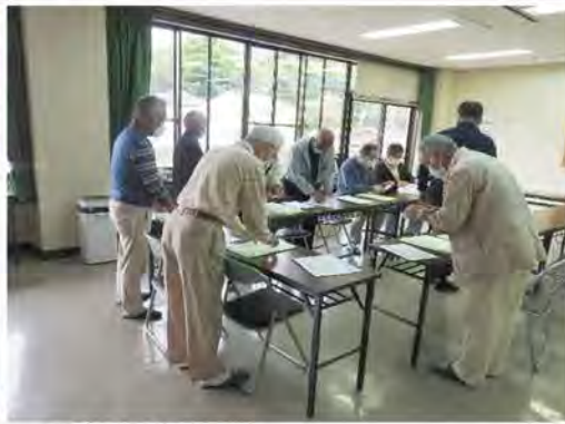
△総会資料発送準備 令和4年度の愛川戸陵会総会は、続くコロナ禍の現況を鑑み5月7日の役員会において3年連続となる書面総会と決し、会員への総会資料配布の準備をしました。