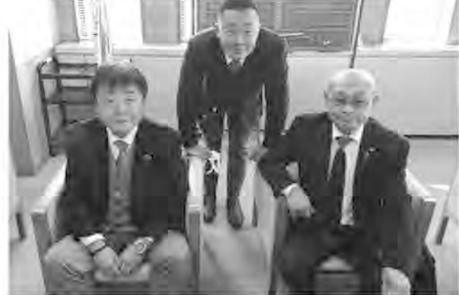
左から長嶋、館、小沼の各市議