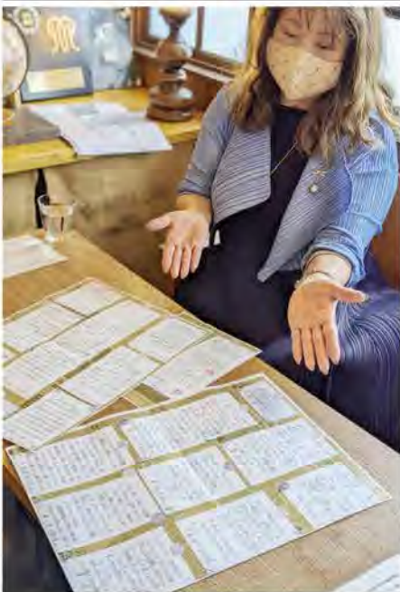
送付されたアンケート

私達にとってこの2年余り、コロナという前代未聞、最強のウイルスに、世界中の人々が生命の危険はもとより生活も経済も狂わせられ、会社の業務やサークルの会議、そして教育までもがリモートで行われる等々、様々な人に関する環境の形勢が変わろうとしている現状を鑑みると、益々人間関係が希薄になっていきほしくないかと危惧の念を抱きます。 津久井戸陵会においてもご多分にもれることなく、コロナ感染予防重視の観点から、今年度を含む計3回の総会及び懇親会の中止を余儀無くされたことは、誠に残念でなりません。そこで、津久井戸陵会の誇れる特徴でもある親しみのある人と人の話の輪の絆をこんな状況下、ささやかであっても保持していけたらと今できる策を弄し、一方通行ではありませんが、紙上懇談会と銘打っての近況報告を会員の方々に届けたいと思いました。 総会及び懇親会中止通知を往復書簡にし、返信欄に各々の近況を綴っていただきたく送付いたしましたところ、19名の方々が返信下さいましたので、お一人お一人の顔を思い浮かべつつまとめ、厚高同窓会会報を同封してお届けいたしました。 返信の有無に限らず皆様には喜んでいただけたのではと思っております。 来年度こそは、コロナ禍も収束して無事総会及び懇親会が開催された折りに、「こんなことあんなことあったよネ」と、この紙上懇談会も看に笑いながら楽しい会話が弾むことを強く念じながら、筆を走らせました。どうぞ、その時を楽しみにお待ちしております。