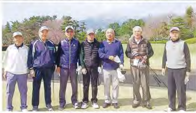
第49回大会(令和4年3月23日本厚木CC)

母校厚木高校を昭和36年3月に卒業した今年80歳を迎える元氣なゴルフメンバです。平成14年4月に還暦を迎え、会社勤務も順調、会社経営も順調、そんな仲間ゴルフをやるう、そんな呼びかけで、第1回は厚木厚木CCで実施、参加メンバー24名で6組と大人数でした。年を重ねるとだんだんメンバーが減少して平成24年4月は16名位になって、令和4年3月23日第49回厚木厚木CCではコロナ禍でもあり、7名となりました。第50回記念は中津川CCで開催予定です。是非とも4組16名位の参加メンバーを考えておきます。