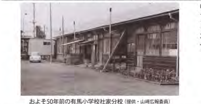
およそ50年前の有馬小学校社家分校

市制施行は、1971(昭和46)年11月1日で、当時の人口は約4万8千人でありましたが、50年後には約13万7千人、約3倍と大幅に増加しました。この増加の主な要因は、交通の利便性にあると思います。海老名駅は県央にあつて、都心にも比較的近く、小田急線・相模線・JR相模線が交差し、圏央道の海老名インターチェンジもあります。