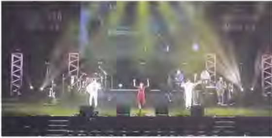
「軽音楽の甲子園」『We are SNEAKER AGES』では準グランプリを受賞した(グランキューブ大阪)