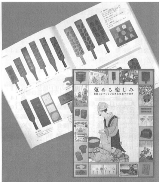
東京赤坂の「虎屋」が吉田コレクションを展示・出版