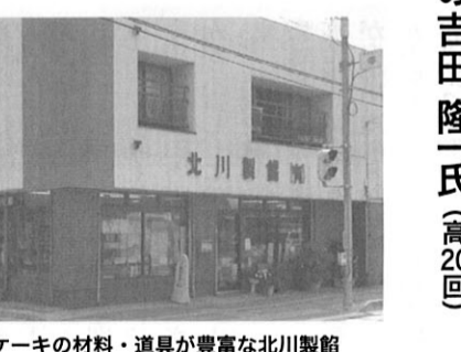
菓子やケーキの材料・道具が豊富な北川製菓

北川製菓と呼ぶより「あんこ屋さん」の方が通りがいい。それほどに近在では名の知れたお店である。