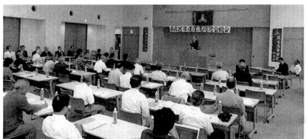
平成25年度 同窓会通常総会