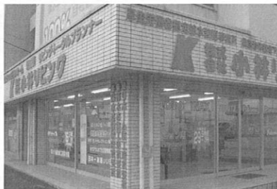
県や市から優良企業としての数々の賞を受賞