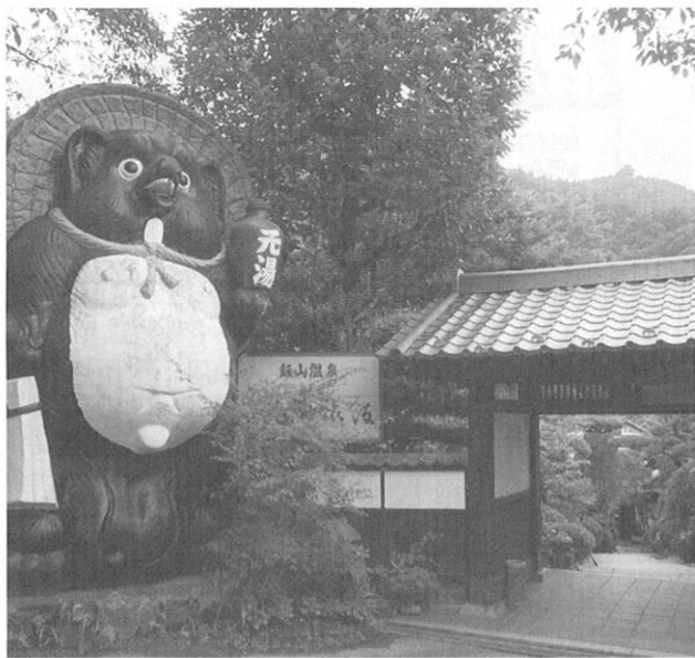
シンボルの「大ダヌキ」が迎えてくれる元湯旅館

元湯旅館の創業は、江戸時代の後期といわれ、明治8年に出版された「皇国地誌」に当時の様子が紹介されている。「皇国の湯」として話題になっている。客室は、昔ながらの純和風な和室に、丁寧に装飾した床の間。床柱の名前を部屋の名前に使うなど、木への愛情は人知れず大