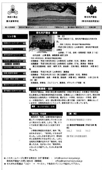
南毛利戸陵会のホームページ