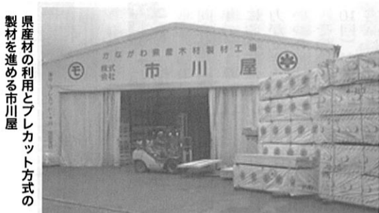
製材材の利用とプレカット方式の市川屋

プレカット方式というのは、建築主の計画を図面にした設計図を、CADといつてパソコンを使って加工図に書き換え、そのデータを機械が読み取り、全自動で木材を切ったり、削った