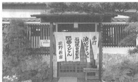
石臼挽自家製粉の店「浪花そば」

「手打ち 石臼挽き自家製粉の店 浪花そば」と大書された暖簾をくぐり、入り口を開けると「いらっしやいませ」という明るい奥さんの声に迎えられる。ここは厚木市で最初に石臼を導入した手打ちそば「うどんの老舗 浪花そば」である。創業は昭和44年、兄の食堂を肩代わりした時に、周囲の勧めもあり「手打ちそば」を志して大阪で修業する。その後、依知で開店し中町へ移転後、現在の荻野に店舗を