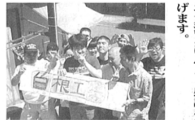
利用者の「地域で生きる」を目指す白根工房

障害者施策は目まぐるしく変化し事業所運営は苦労が絶えません。しかし、特に昨年の障害者権利条約への批准等、権利擁護は大きく前進しています。原点は「地域で生きる」。その理念は地域作業所にあると思います。福祉先進県といわれた神奈川県、星の数ほど作業所を！と地域のなかで大きく発展してきました。