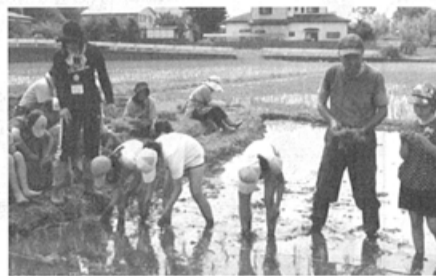
田植えの体験学習も