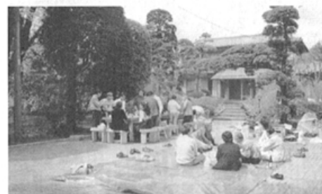
広い自宅の庭を地域住民に解放

神崎家の門に近づくと、庭には元氣よく遊び回る大勢の子供たちの歓声があり、その親と思われる数人の大人の姿も混じる。ここは子供たちの自由な遊び場。その親たちの歓談の場として自宅の広い庭が解放されている。