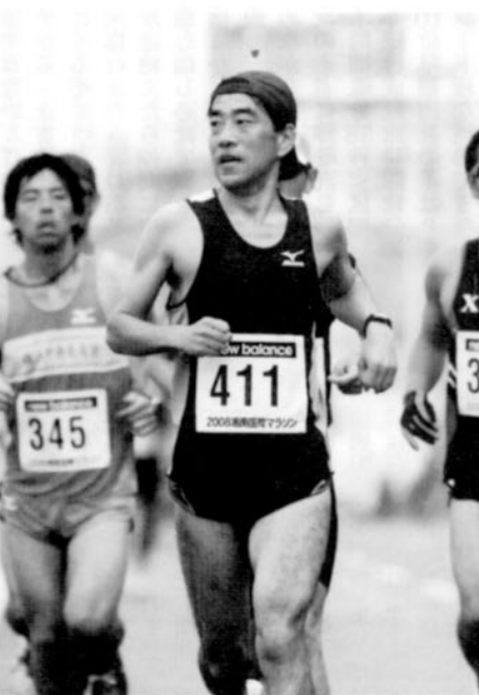
54歳で自己ベストを出した湘南国際マラソン

すが、私からは、大臣が答えにくい厳しい質問をぶつけました。地方移管分をせずに公務員人件費の2割カットや、天引き禁止で再就職できなくなるなら新規採用の半減も、など。このもようは衆議院