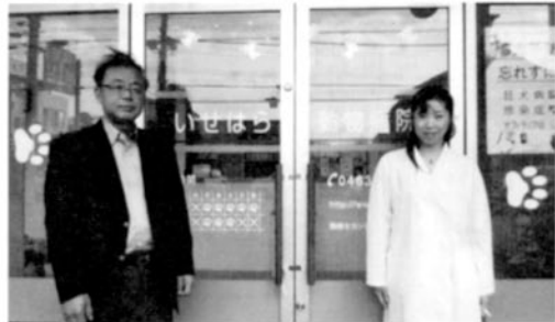
偶然にもお隣りさんは柔道部の先輩

開業直前には伊勢原戸陵会の集まりにも呼んでいただき、地元の方々とお知り合いになる機会を得ることができました。これからの人の縁を大事にしなが伊勢原の獣医療や動物との暮らしが豊かになるお手伝いをしていきたいと思