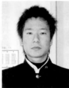
3月1日、第62回卒業式が行われ、319名の相州健児がそれぞれの道へと旅立っていった。...