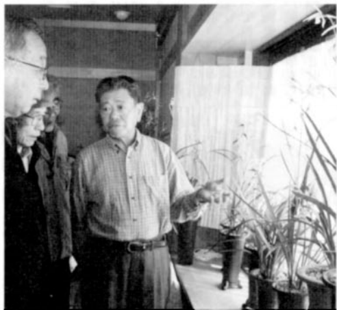
清川村物産館「清流の館」で開催した「寒蘭展」

で4月に「80鉢のえびね展」を、11月に「50鉢の寒蘭展」を開催し、村や近隣の町からそれぞれ100名以上の来場者があり、大変喜んで頂いています。今年も3月上旬に「春蘭展」、4月下旬に「エビネ展」と11月中旬に「寒蘭展」を、清川村「清流の館」で開催する予定です。