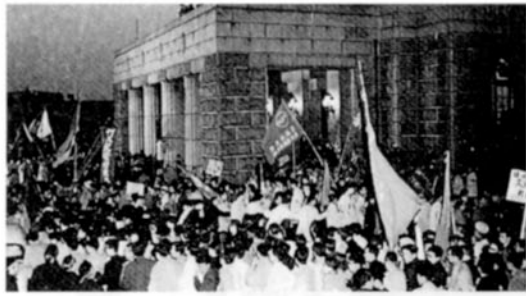
国会構内に入るデモ隊(昭和34年11月27日)

今年、日米安保条約改定から50周年にあたります。安保と私の青春は、切り離せません。昭和30年3月の母校卒業式には、岡崎賞という賞を頂きましたが、その岡崎男先輩(中9回)は、旧安保条約のもとでM.S.A協定を米国と締結したときの外務大臣でした。東大1年生のときに立川基地拡張反対のため砂川に出掛けてデモ