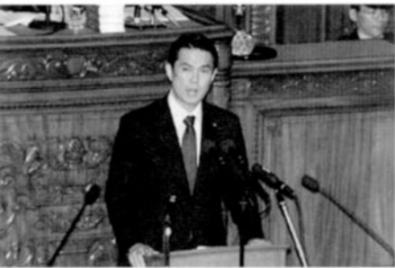
本年4月6日の衆議院本会議

同窓会の皆様には、日頃より大変お世話になっており、厚く御礼申し上げます。また、「同窓林の下刈り」(懐い出の杜に親しむ会)を