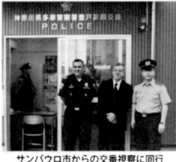
サンパウロ市からの交番視察に同行

サン・パウロ州軍警察本部勤務を終え、一昨年3月に帰国。単身での現地生活は、大変ではありましたが、ブラジル人の温かさや日