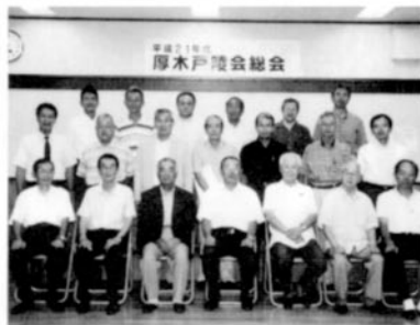
支部会活動にも補助金が

この期にあわせて本部では、「同窓会活動活性化補助金交付要綱」を作成し、今までの同期会に加え、支部総会などにも補助金を出すことにいたしました。細部については、同窓会ホームページをご覧ください。