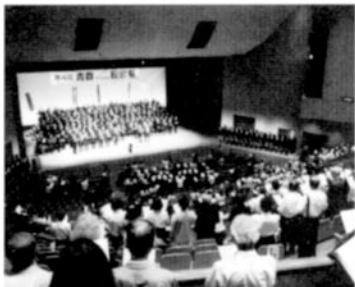
客席も総立ちでフィナーレの大合唱

年間事業の中で、何と言っても「厚木高校同窓会ここに在り」の存在感を県下に轟かせたのは、10月の校歌祭であった。実行委員長校として県立高校同窓会をまとめ、2000名を超える参加者を厚木にお迎えできたことは幸甚なことであった。