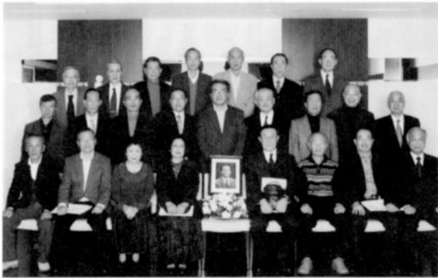
同期の友の遺影を囲んで再会を約する

そして、次回は、7年後の「70年・古希」開催(高17回の学年同窓会は、創立110周年の平成24年を予定)