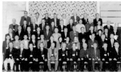
70名をこえる集いに厚高時代の思い出がよみがえる

「戸室の丘辺、旭日さして...」 「伝統古き三剣の...」 応援団だったK君やI君の指揮