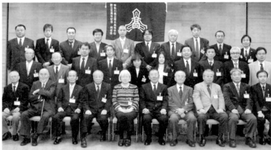
今回もまたいつもの元気な仲間が再会 (21年11月の総会)

懇親会は、総勢30名での会となりましたが、その会での話題はというと、秦野戸陵会からも多くの会員が参加した「第4