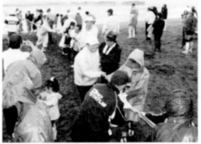
家族連れで賑わった昨年の地引き綱会

同窓会費の納入状況は順調に推移し、卒業生の入会金を含めて620万円の納入があった。お陰様で以下に報告する各事業も活発に行われた。