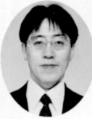
剛健・真剣・勤儉