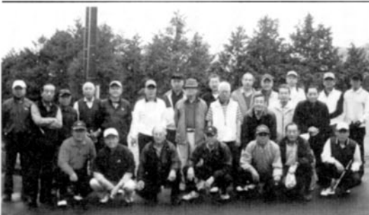
土地柄ゴルフ好きの多い荻野戸陵会

荻野は地元にも多くのゴルフ場を有する支部でもあり、ゴルフ人口も多くゴルフコンペの組み合わせは、過去13回平均7組(26~7名)となっております。また、ゴルフをしない会員の方を考慮して、一昨年は大山ハイキングを実施し、紅葉を楽しみ大変好評でしたので、現在若葉の高尾山ハイキングを企