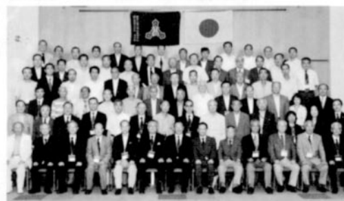
盛会だった昨年の同窓会総会

6月27日総会開催 平成22年度の厚木高校同窓会定期総会を次のとおり開催します。 日時/6月27日(日) 午後1時30分より 会場/厚木商工会議所 5階大会議室 案件/平成21年度事業報告 平成22年度決算報告 平成22年度予算案 平成22年度予算案 他 総会終了後、写真撮影及び懇親会を予定しています。