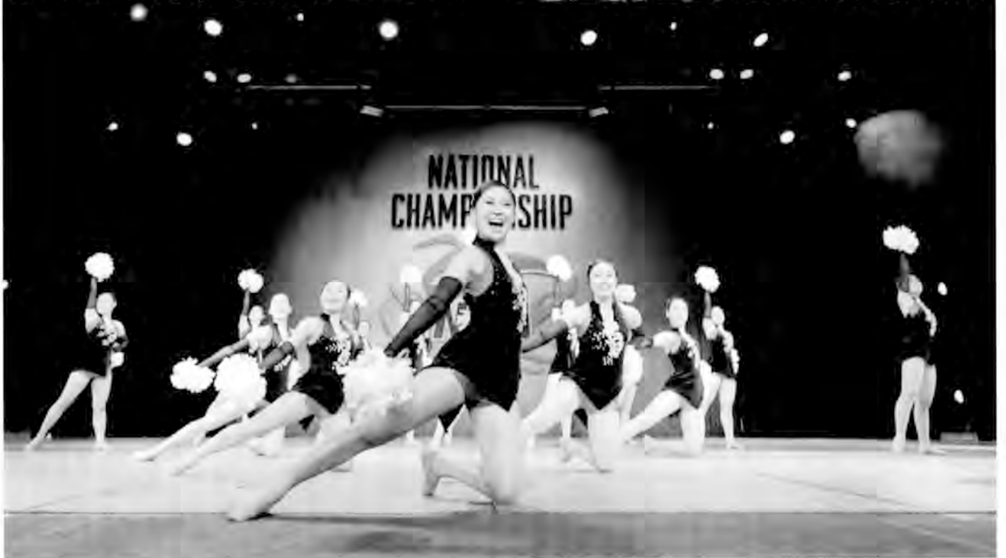
厚木高校ダンスドリル部の部員 15名は3月5日(現地時間)、米国フロリダ州オーランドで開催された全米チアダンス選手権で見事準優勝。13年前のグランプリに次ぐ快挙となった。(特集2・3面)