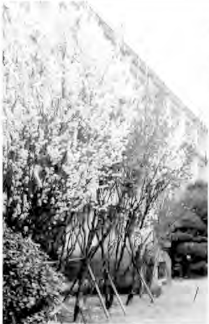
正面玄関左手のハナモモが今年も見事に咲いた