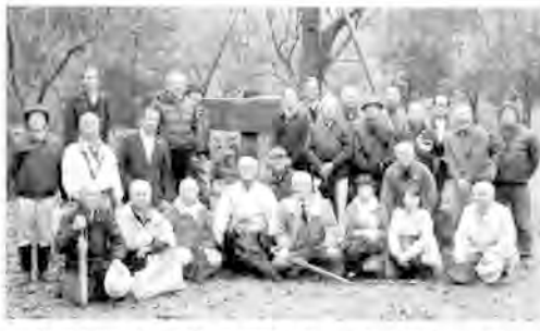
生憎の雨の中、多数の同窓生が集った「思い出の杜」

平成28年11月19日(土)、晩秋の日差しの中で、半原の山々の紅葉が、ここ数年にない美しさであったので、皆様に観て頂きたく期待していましたが生憎の雨。その雨の中、23名の方が「思い出の杜」に参集しました。