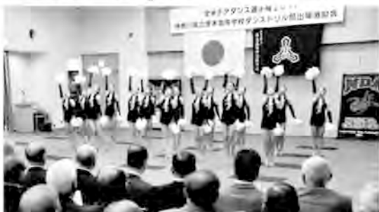
2月12日、同窓会主催の激励会が開催された

選手の激励壮行会に270名 平成29年2月12日(日)午後1時30分より厚本商工会議所にて厚本高校ダンスドリル部全米選手権出場選手激励会が、厚本高校同窓会主催でダンスドリル部保護者会OG会、応援団OB会の絶大なるご協力のもと、開催された。会場に入れぬ程多くの同窓生をはじめとする方々が応援に駆けつけた。また、当日会場に來られぬ方からも寄付を預かりました。