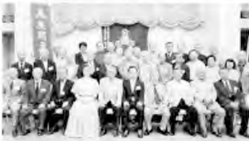
役員改選を機に座間戸陵会の活性化をめざす

今、厚木市愛甲で小さな病院を開業しています。専門は循環器内科ですが、町医者なので、実に多種多様な疾患の患者さんが来院します。心疾患は救急医療と密接です。秒単位での処置が生死を分けます。目の前の瀕死の患者さんを救うためには考える前に手や足が動かなければなりません。昔はスマートフォンならぬ、ポケットベルが常時携帯必需品。夜間の呼び出しは、まさにスクランブル。ストレスの最前線にあり、救命に癒される日々でした。同時に地域医療との連携が生死を左右することを実感させられました。