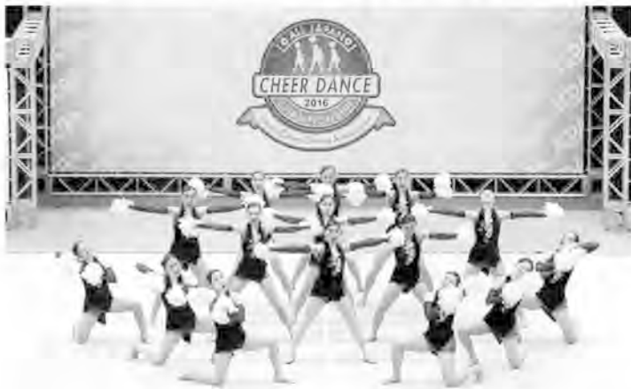
5連覇を達成した福井商業高校に及ばなかったものの、夢の舞台上で最高の演技を見せたIMPISHのメンバー