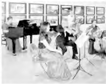
故郷の北海道東川町での写真展に合わせたギャラリーコンサート

コントラバスの元中学校校長、ピアノノアは地元でピアノ教室主宰など写真展来場者ともどもみんなお互いに顔見知りなのです。今回は「旭川一小各停列車の旅」を予定、撮影中。各写真展は全紙からA1などのプリント約百点なので大きなギャラリーが必要