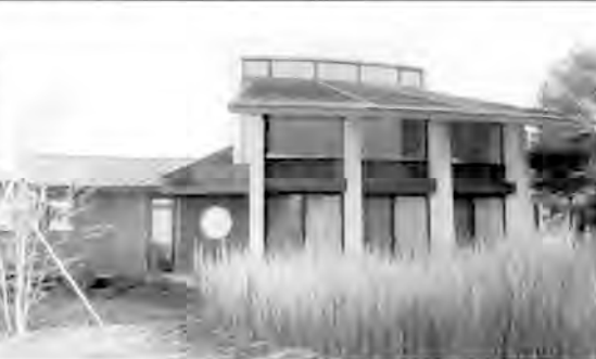
地域の音楽・文化活動の拠点に期待される「大島記念音楽堂」