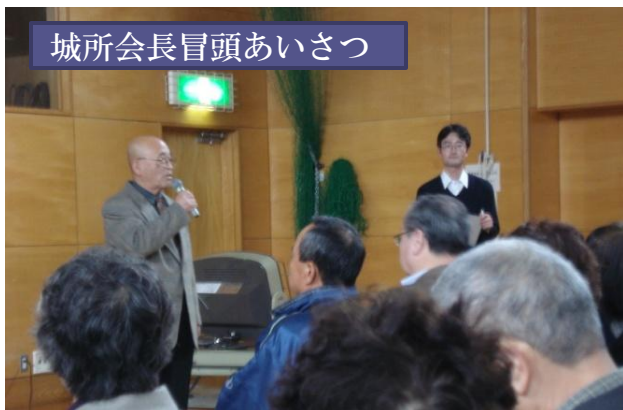
城所会長冒頭あいさつ